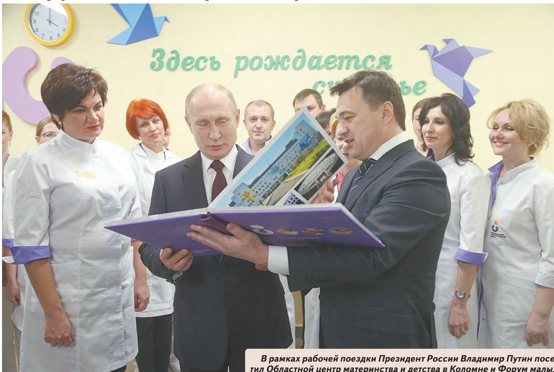
В рамках рабочей поездки Президент России Владимир Путин посетил Областной центр материнства и детства в Коломне и Форум малых городов и исторических поселений.